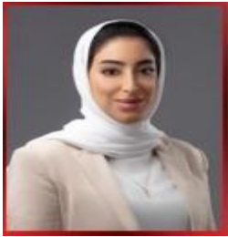
السيدة فاطمة جعفر الصيرفي نائب الرئيس التنفيذي لهيئة البحرين للسياحة والمعارض