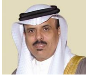
صاحب السعادة الدكتور ماجد بن علي النعيمي وزير التربية والتعليم / رئيس مجلس أمناء مجلس التعليم العالي