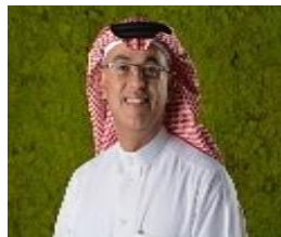
الدكتور طارق محمد السندي مدير عام الإطار الوطني للمؤهلات والامتحانات الوطنية بهيئة جودة التعليم والتدريب