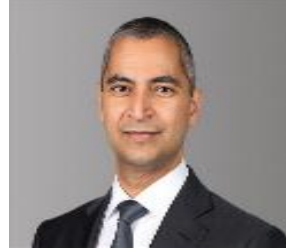
السيد خالد إبراهيم حميدان الرئيس التنفيذي لمجلس التنمية الاقتصادية