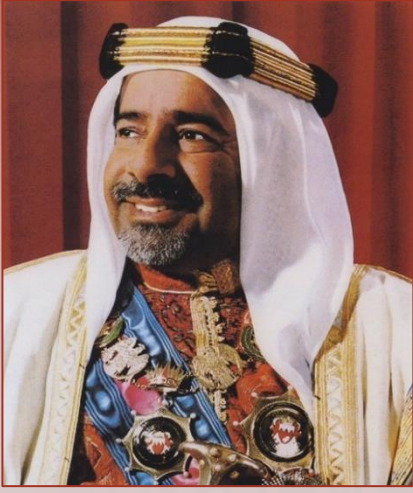
صاحب السمو الملكي الأمير الطاه عيسى بن سلمان آل خليفة سلطان طيب الله ثراه