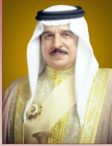
حضرة صاحب الجلالة الملك حمد بن عيسى آل خليفة ملك مملكة البحرين المفدى