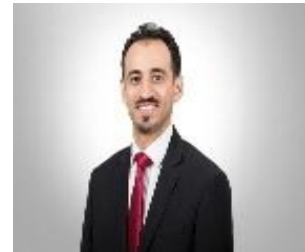
السيد حسين محمد رجب الرئيس التنفيذي لصندوق العمل (تمكين)