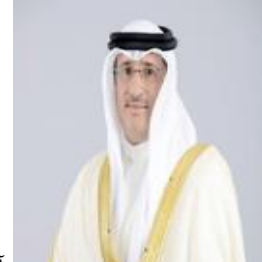
معالي الشيخ محمد بن عيسى بن محمد آل خليفة رئيس مجلس إدارة صندوق العمل