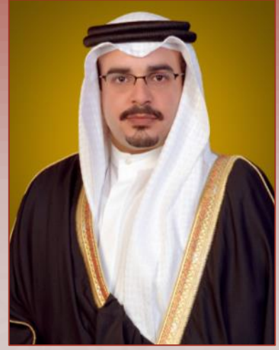
صاحب السمو الملكي الأمير سلمان بن حمد آل خليفة ولي العهد نائب القائد الأعلى رئيس مجلس الوزراء